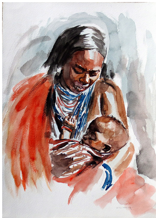
祖母与婴儿 帕特里克·基努西亚 (Patrick Kinuthia) 的绘画